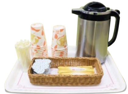
セルフサービス (紙コップ)