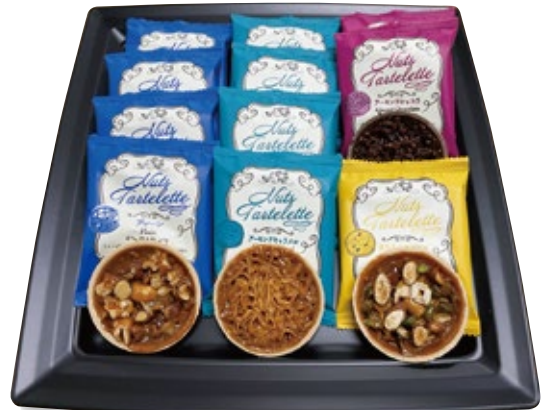
4種のタルトレット 2,500円 (税込2,750円)