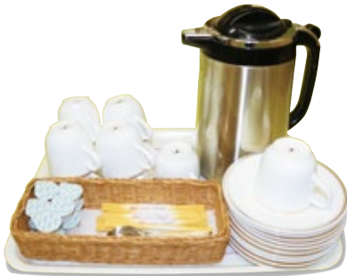
セルフサービス (カップ&ソーサー)