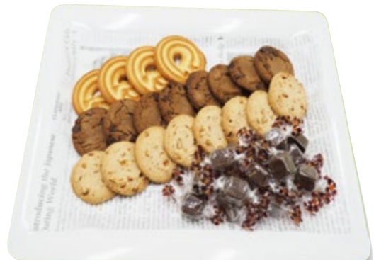
クッキー&チョコ 1,000円 (税込1,100円)