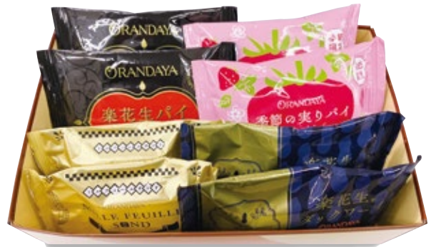
千葉銘菓 (洋菓子) 1,300円 (税込1,430円)