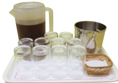
セルフサービス (グラス)