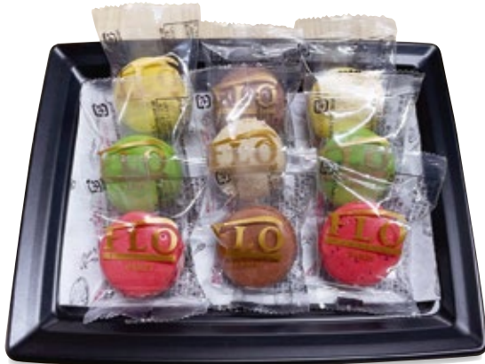
マカロン 2,000円 (税込2,200円)