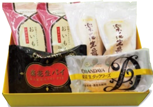
千葉銘菓 (和菓子) 1,300円 (税込1,430円)