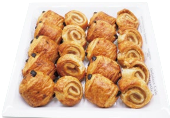
ペストリー 2,000円 (税込2,200円)