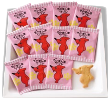
チーバクそのまんまサブレ 1,200円 (税込1,320円)