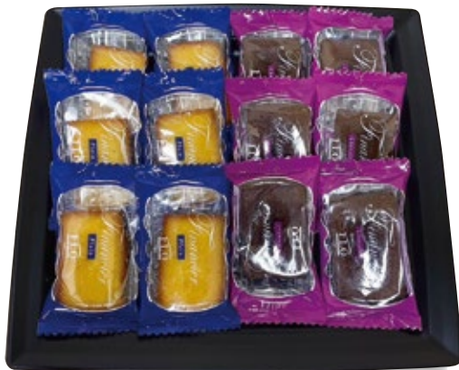
フィナンシェ 3,000円 (税込3,300円)